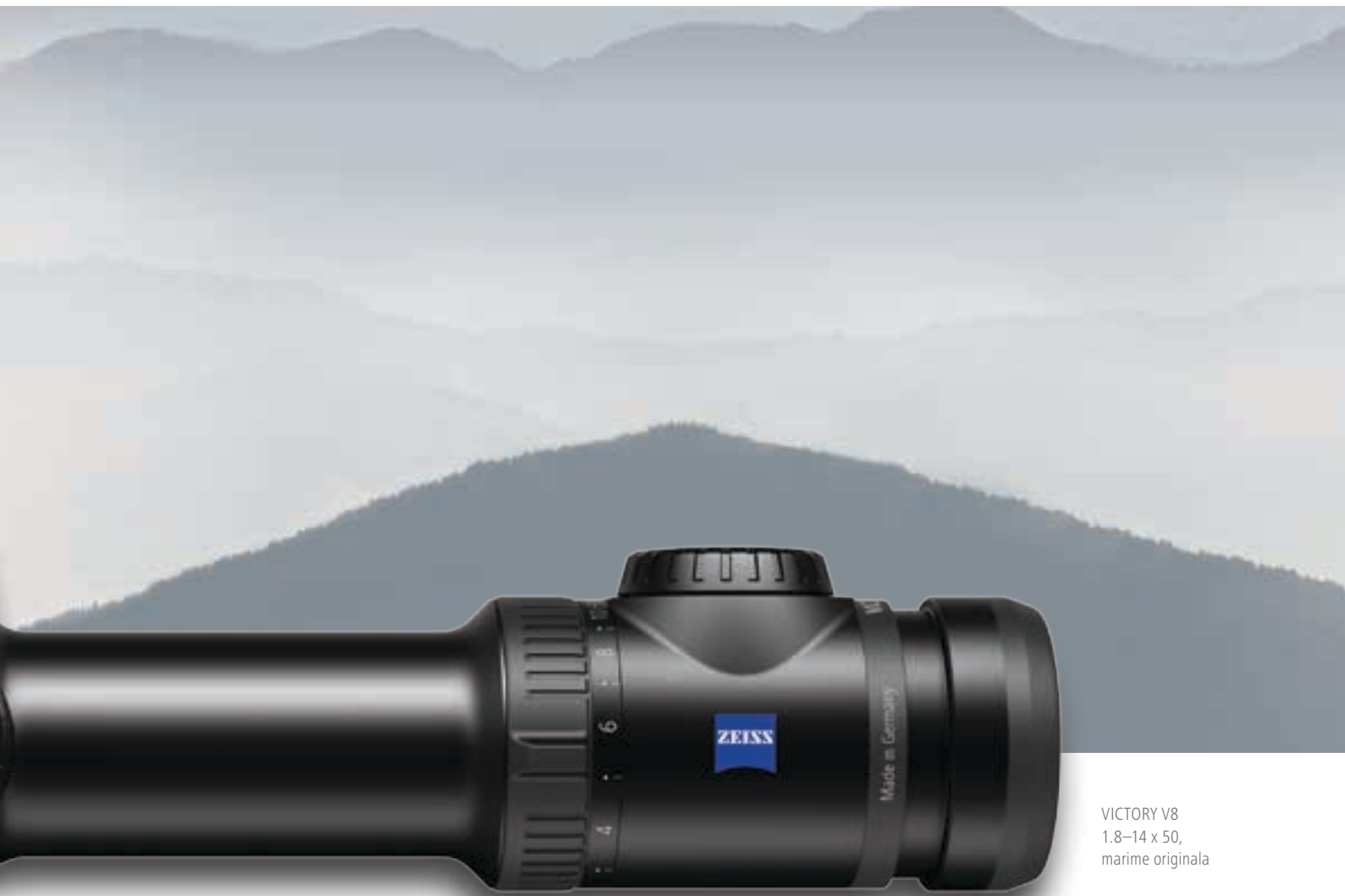
VICTORY V8 1.8-14 x 50, marime originala